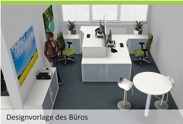
Designvorlage des Büros