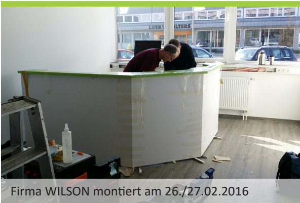
Firma WILSON montiert am 26./27.02.2016