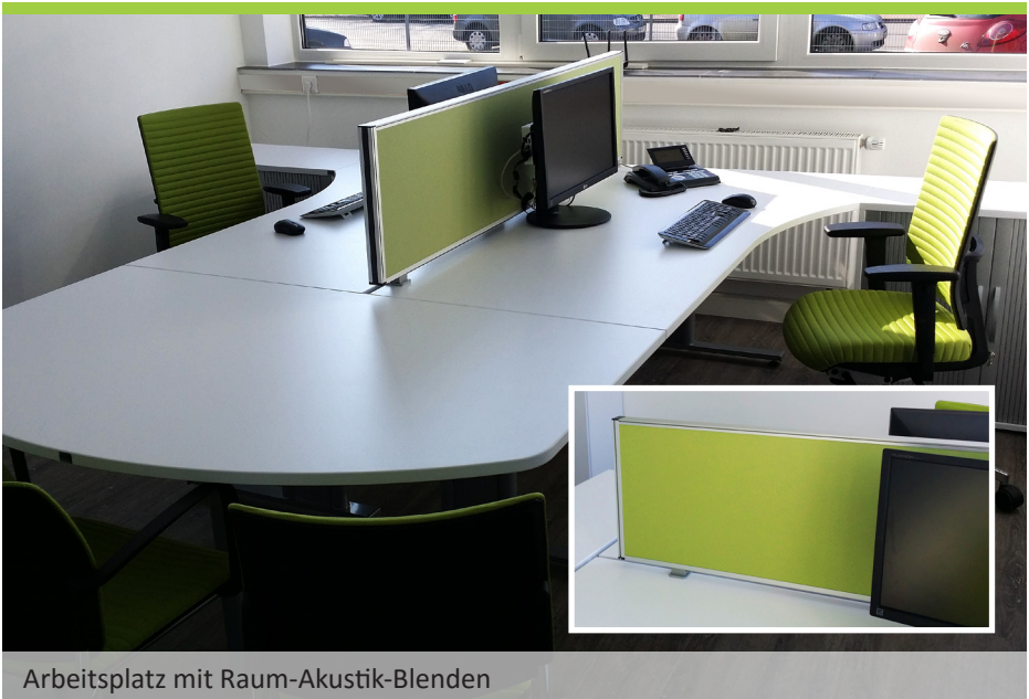
Arbeitsplatz mit Raum-Akustik-Blenden