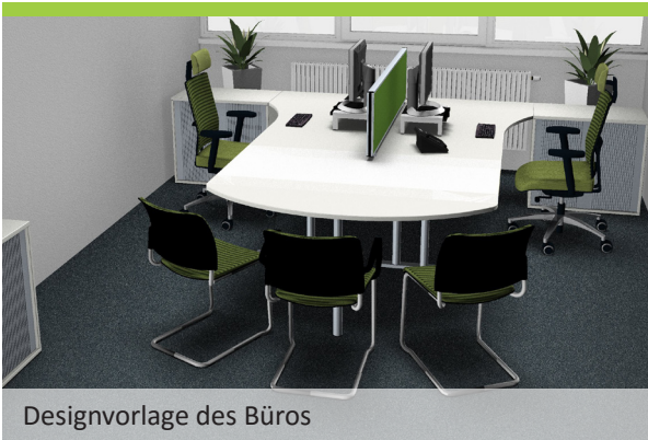
Designvorlage des Büros