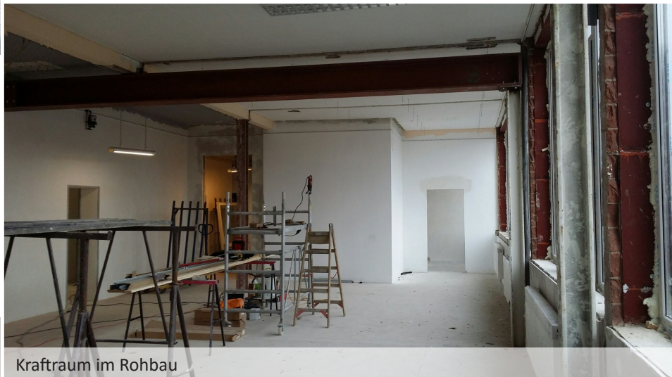
Kraftraum im Rohbau