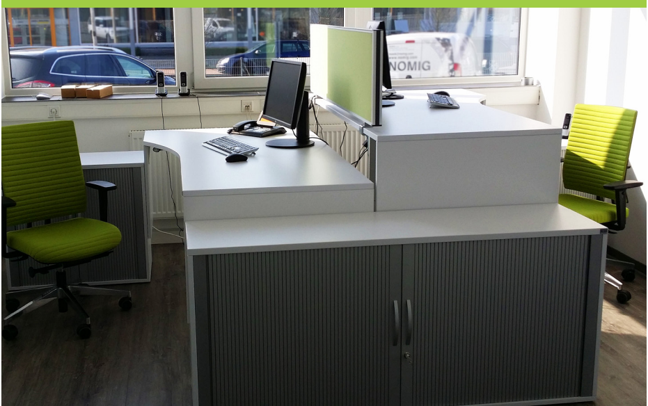
Arbeitsplatz mit höhenverstellbaren Schreibtischen