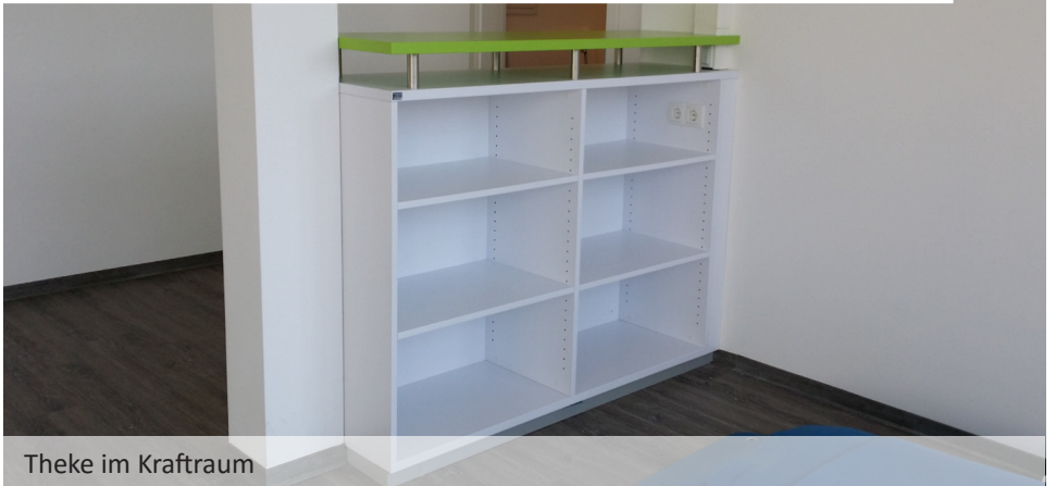
Theke im Krafraum